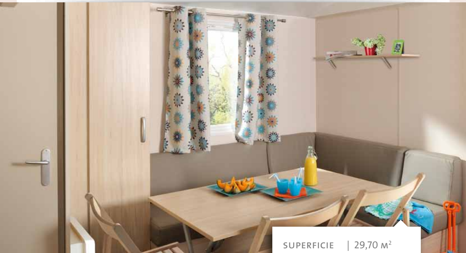
Ambiance présentée : FARNIENTE, rideaux Gipsy, assise Taupe.

SUPERFICIE | 29,70 m 2 DIMENSIONS | 8,04x4,00 m* COUCHAGE | 6 PERS.