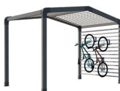
Range-vélos et/ou stockage

Sas d'entrée, espace détente ou de stockage, chambre indépendante, les modul'homes s'adaptent aussi bien aux mobil-homes 1 pente que 2 pentes. Ils peuvent se positionner en pignon, comme un sas ou détaché du mobil-home.