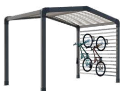
Range-vélos et/ou stockage

Sas d'entrée, espace détente ou de stockage, chambre indépendante, les modul'homes s'adaptent aussi bien aux mobil-homes 1 pente que 2 pentes. Ils peuvent se positionner en pignon, comme un sas ou détaché du mobil-home.