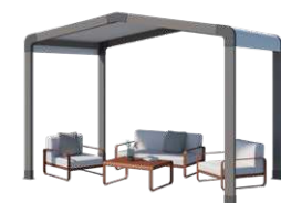
Espace de détente